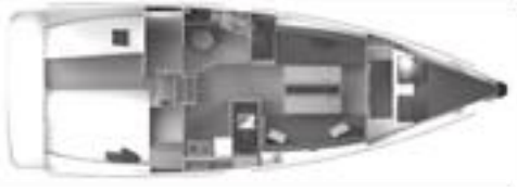
Versiyon A 1 baş kabin, 1 kiç kabin, 1 WC