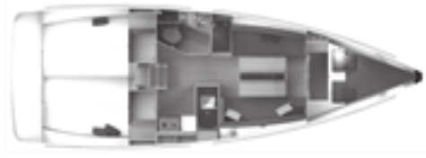
Versiyon B 1 baş kabin, 2 kiç kabin, 1 WC