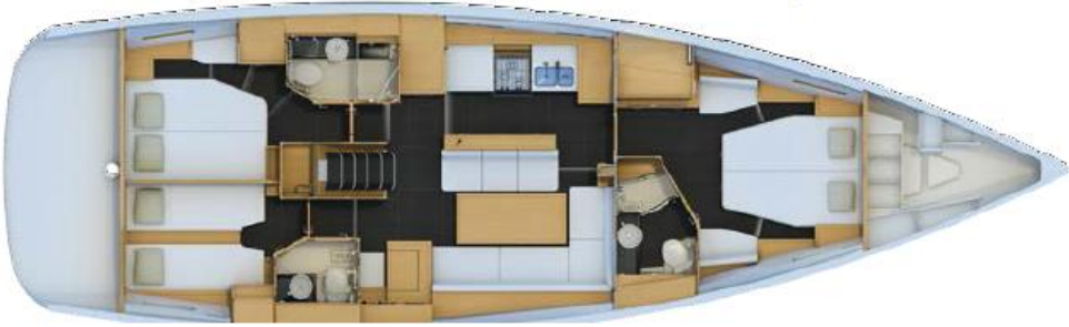
3 Kabin Versiyonu: Bař master Kabin, VIP kiç kabin, Kiç Misafir Kabini (opsiyonel kaptan kabini)