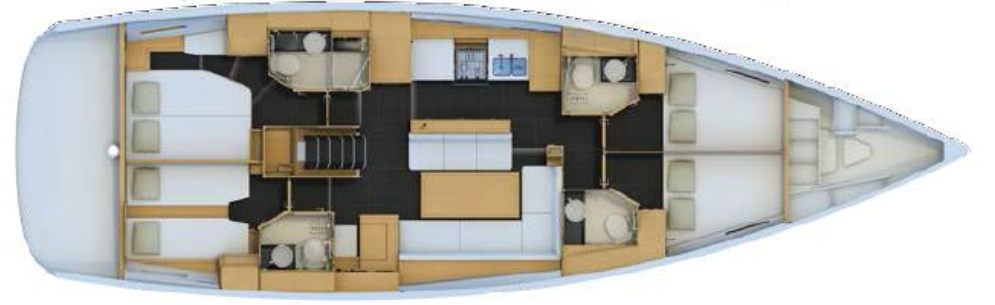
4 Kabin Versiyonu: 2 Dönüřtürülebilir bař kabin, VIP kiç kabin, Kiç misafir kabini (opsiyonel kaptan kabini)