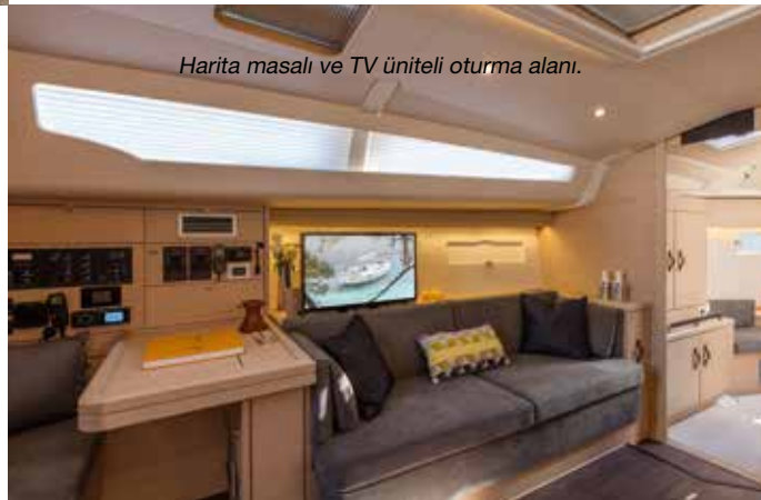
Harita masalı ve TV üniteli oturma alanı.

Sancak baş tarafa U şeklinde altı kişilik bir oturma grubu, önünde de ayakları çıkarılabilen büyük bir yemek masası konumlandırılmış. Oturma grubunun karşısında iskele tarafta da bir bank ve onun sırtlığında liftli bir televizyon ünitesi