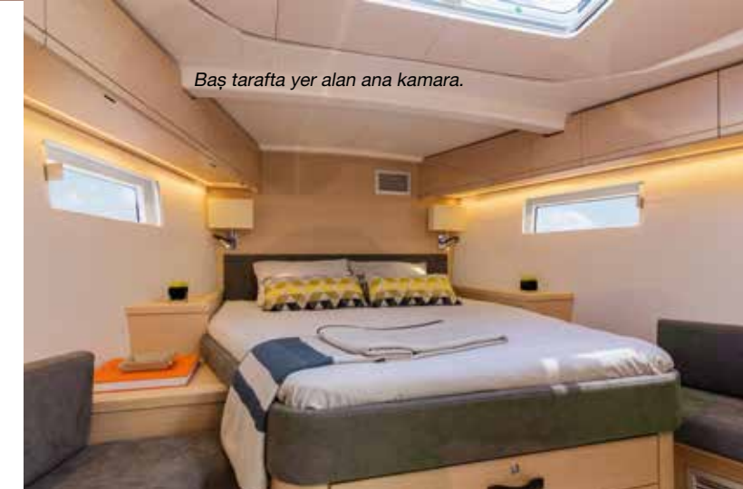
Baş tarafta yer alan ana kamara.

yer alıyor. Baş taraftaki ana kamara ferahlığı, büyük yatağı ve iki taraflı oturma yerleri, kendine ait banyosu ve büyük askı dolabıyla oldukça konforlu. Ana kamara önünde, başaltında yelken saklama alanı bulunuyor. Güvertede hecinden girilen bu depodan baş pervane ve teknik alanlara da erişim mevcut.