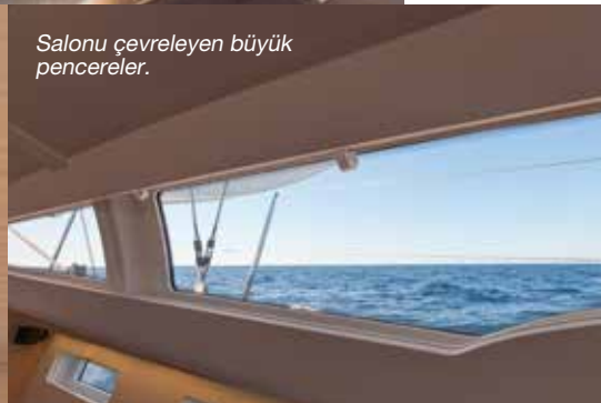
Salonu çevreleyen büyük pencereler.