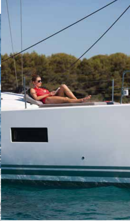
Geniş ve kullanışlı kokpiti, temiz ve düz güvertesiyle Jeanneau 51 dışarıda konforlu alanlar sunuyor.